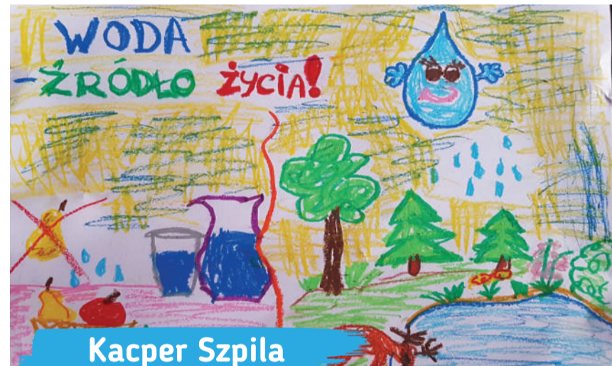
Kacper Szpila kl. 1A, Szkoła Podstawowa nr 24