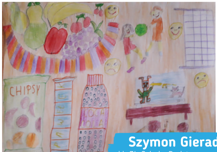
Szymon Gierada kl. 3I, Szkoła Podstawowa nr 51