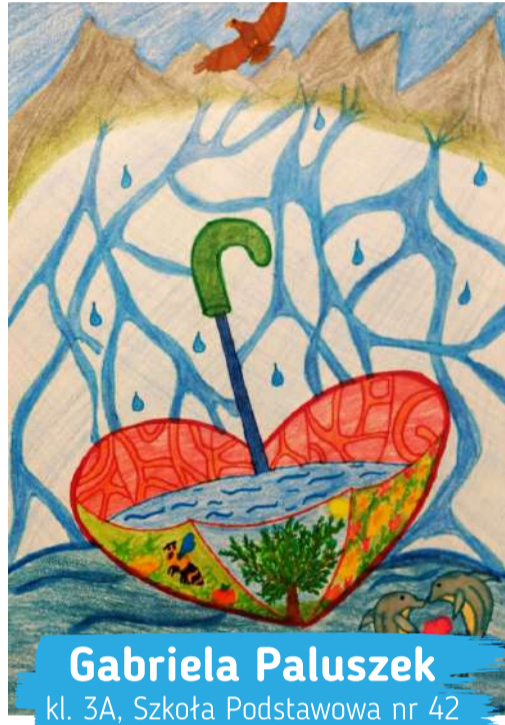
Gabriela Paluszek kl. 3A, Szkoła Podstawowa nr 42