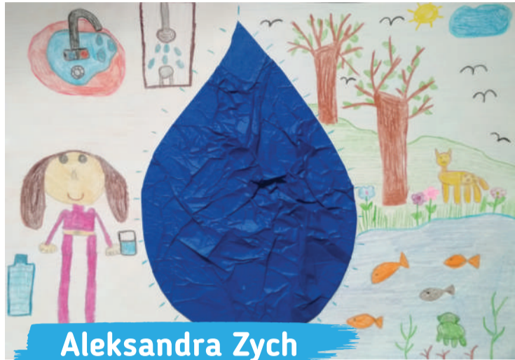
Aleksandra Zych kl. 2A, Szkoła Podstawowa nr 42