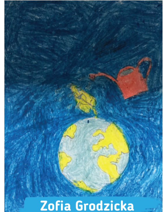
Zofia Grodzicka kl. 1B, Szkoła Podstawowa nr 18