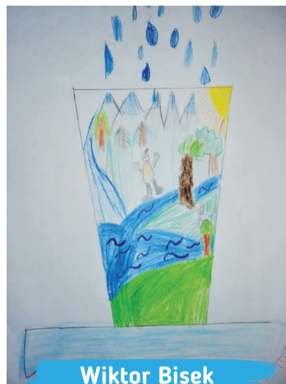
Wiktor Bisek kl. 1A, Szkoła Podstawowa nr 22

Dziękujemy wszystkim uczestnikom konkursu plastycznego pt. „Woda – źródło życia” za przygotowanie fantastycznych prac!