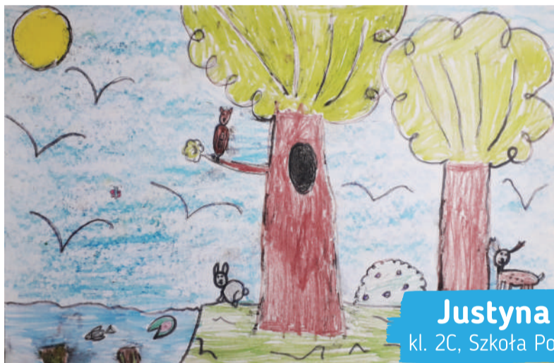
Justyna Smutek kl. 2C, Szkoła Podstawowa nr 22