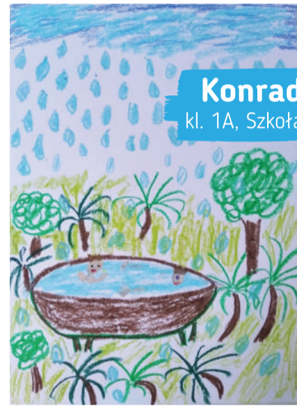
Konrad Błażewicz kl. 1A, Szkoła Podstawowa nr 42