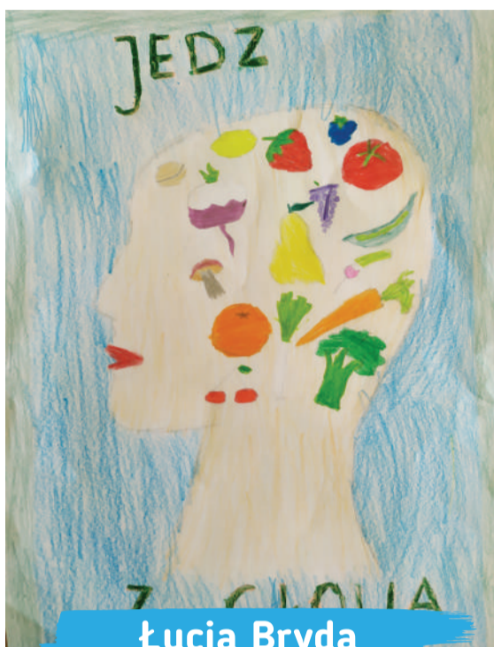
Łucja Bryda kl. 1B, Szkoła Podstawowa nr 44