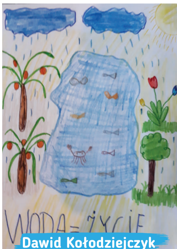
Dawid Kołodziejczyk kl. 2A, Szkoła Podstawowa nr 24