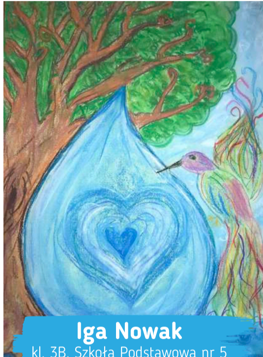
Iga Nowak kl. 3B, Szkoła Podstawowa nr 5