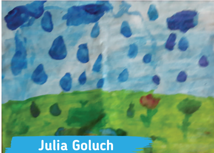
Julia Goluch kl. 1A, Szkoła Podstawowa nr 42