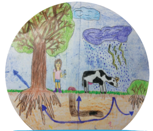
Zofia Buszowska kl. 2B, Szkoła Podstawowa nr 51