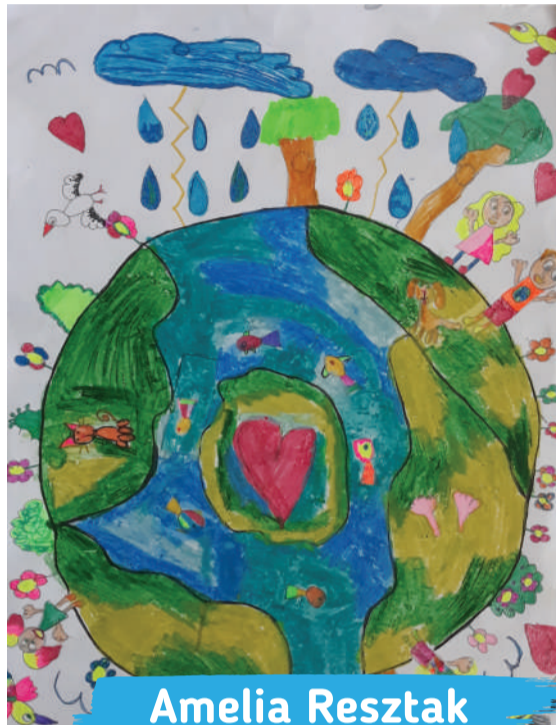
Amelia Resztak kl. 3B, Szkoła Podstawowa nr 24