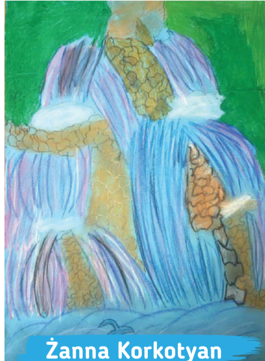
Żanna Korkotyán kl. 2E, Szkoła Podstawowa nr 5