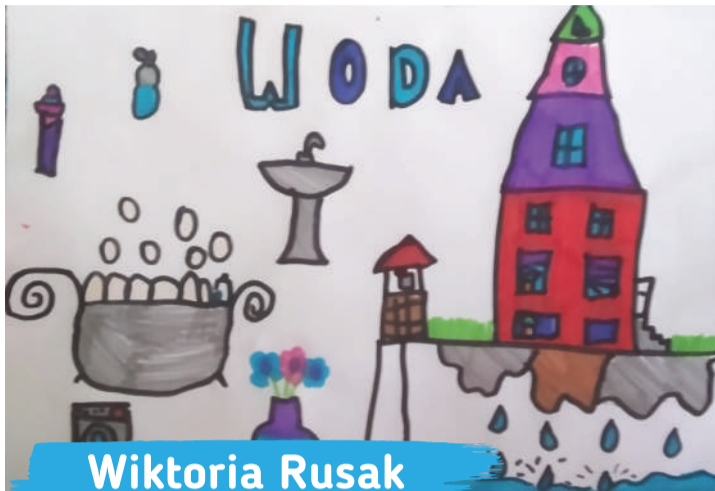
Wiktoria Rusak kl. 1C, Szkoła Podstawowa nr 52