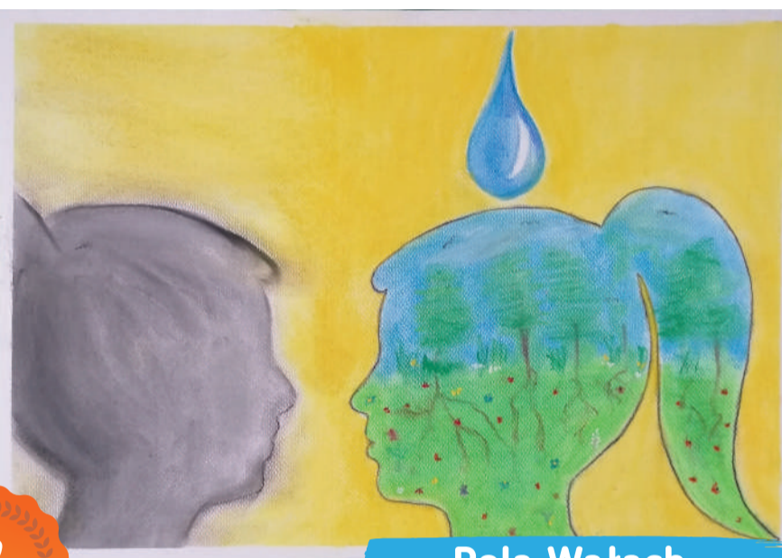
Pola Wałach kl. 3A, Szkoła Podstawowa nr 42